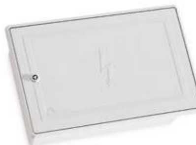
06CAD-F Caixa de coluna com fechadura para dois circuitos trifásicos