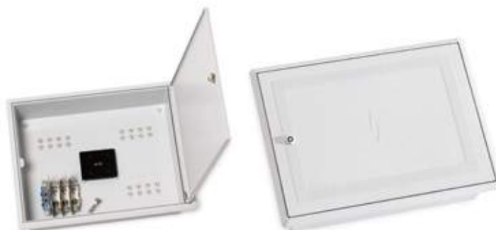
06CAQ-F Caixa de coluna com fechadura para quatro circuitos trifásicos